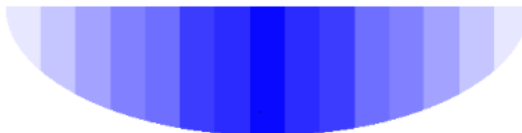
Querschnitt beim tiefengemittelten 2D-HN-Modell